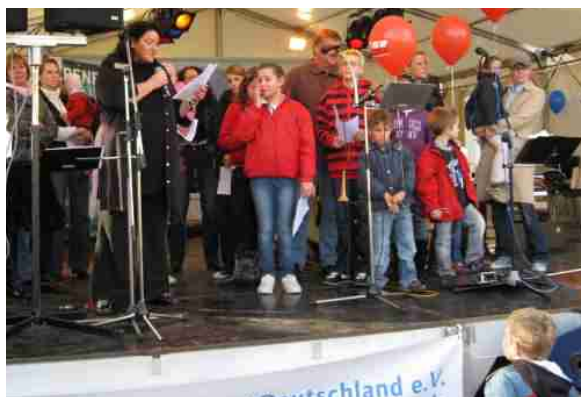
Mehr als 1.000 Menschen folgten dem Aufruf der AG Landau zum Stand Up im Oktober 2008.