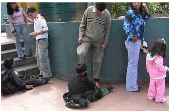
Diese beiden kleinen Schuhputzer aus Cusco in Ecuador sind erst sieben Jahre alt.

Nach Schätzungen der ILO (die Internationale Arbeitsorganisation ist eine Sonderorganisation der Vereinten Nationen) sind etwa 246 Millionen Kinder weltweit von Kinderarbeit betroffen. 179 Millionen Mädchen und Jungen zwischen fünf und 14 Jahren - jedes achte Kind weltweit – sind schlimmsten Formen der Kinderarbeit ausgesetzt. Darunter werden Tätigkeiten verstanden, die das körperliche, sittliche oder seelische Wohl von Kindern gefährden.