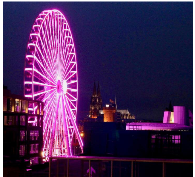
Köln am Vorabend zum Welt-Mädchentag.

In Essen erstrahlte erneut das Baldeney-Sperwerk und am Essener Grillo-Theater zierte ein riesiges Transparent die Fassade. Die noch junge AG Koblenz beleuchtete erstmals das Deutsche Eck und das kurfürstliche Schloss, AG-Mitglieder in Lübeck , Hamburg , Bielefeld , Magdeburg , Köln , Aachen , Bonn , Koblenz und Augsburg pinkifizierten gleich mehrere markante Gebäude. Die AG Wolfsburg/Gifhorn erreichte sogar die Beleuchtung von ganzen neun Objekten in gleich drei Städten!