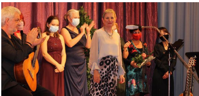
Benefiz-Gala in Mannheim.

Die Plan-Aktionsgruppe Mannheim veranstaltete am Vorabend des Welt-Mädchentages eine Benefiz-Gala unter dem Motto „Starke Frauen für starke Mädchen“. Die coronabedingt von 500 auf 99 reduzierte Anzahl von Tickets war zwar schnell ausverkauft, jedoch haben beinahe 300 weitere Menschen die Gala online im Livestream mitverfolgt.