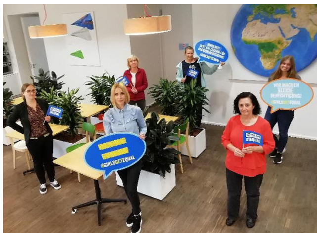
Social Media Seminar in Hamburg.

Für 2021 sind weitere Seminare z.B. zu den Themen Webseitgestaltung, Kommunikation am Infostand, u.a. geplant.