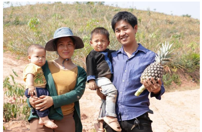
Plan-Projekt für nachhaltige Landwirtschaft und Klimaschutz in Laos

Alle, die sich am Malwettbewerb 2024 beteiligen, unterstützen damit unser Plan-Projekt für nachhaltige Landwirtschaft und Klimaschutz in Laos.