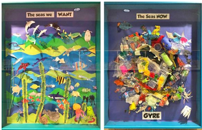
Beitrag zum Weltkindermaltag 2023 aus Luxemburg

oder andere Museen, das Schul- oder Kulturamt oder auch Leerstand in Geschäftszentren an.