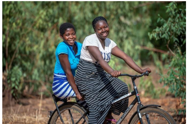
Neues AG-Projekt in Malawi „Bildung macht Mädchen stark“

In Malawi bleibt vielen Mädchen aus Armut und traditionellen Rollenvorstellungen der Zugang zu Bildung verwehrt. 70 Prozent der Bevölkerung leben unterhalb der Armutsgrenze. Vielen Familien fehlt das Geld für den Besuch der Sekundarschule. Vielmehr werden Mädchen früh verheiratet. 42 Prozent der Mädchen in Malawi heiraten, bevor sie 18 sind, neun Prozent sogar vor ihrem 15. Geburtstag. Häufig sind frühe Schwangerschaften die Folge. Sie verhindern, dass die Mädchen den Schulbesuch fortsetzen, einen Beruf ergreifen und ein selbstbestimmtes Leben führen können. Weite Wege und mangelnde Hygieneeinrichtungen in den Schulen kommen als weitere Gründe hinzu, warum Mädchen die Schule abbrechen. Mit Stipendien, dem Bau von Schultoiletten, Spargruppen, Schulungen und der Vergabe von Nähmaschinen und Fahrrädern steigern wir die Schulbesuchs- und Schulabschlussquote von Mädchen in Lilongwe und Kasungu.