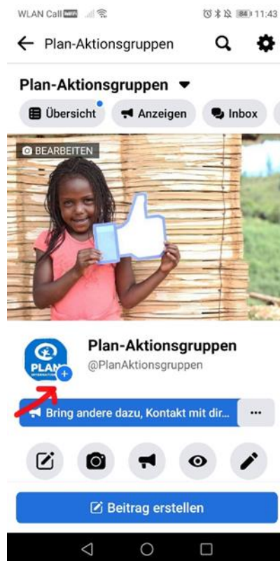
Story erstellen auf der AG-Seite